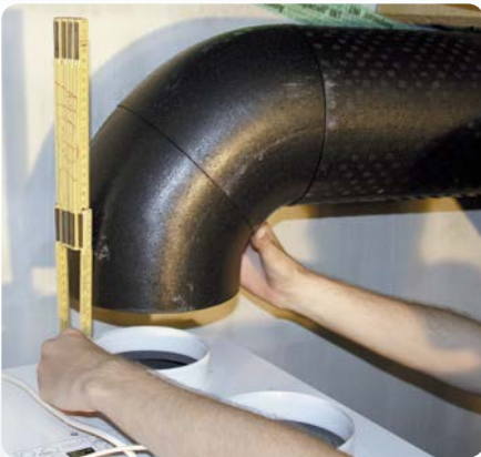
1. Messen ...

IsoPlugg 46: perfekt montiert in drei Schritten