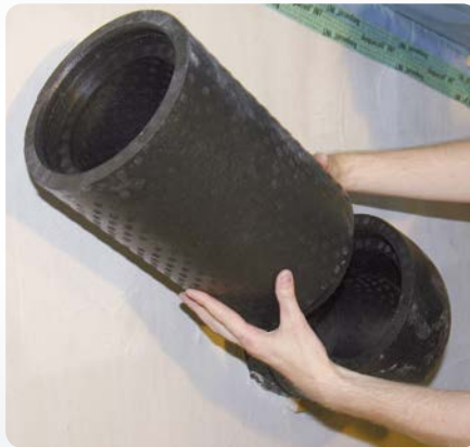
2. Zusammenstecken ...