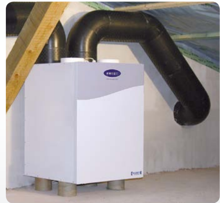
3. ... in Betrieb nehmen